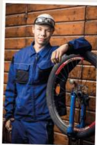
Jugendlicher in der „Manege“ in Berlin-Marzahn

In diesem Jahr kommt die Spende zum Beispiel der „Manege“ in Berlin-Marzahn zugute. Die Einrichtung bietet ganzheitliche Unterstützung in ihren Lebenslagen und auch den Lebensbrüchen an, ein Ansprechpartner ist durchgehend, auch nachts, zu erreichen. Für die Jugendlichen ist es oftmals eine „zweite Chance“; sie bekommen, z.B. durch berufsbildende Maßnahmen, die Möglichkeit, überhaupt ein eigenverantwortliches Leben anzugehen.